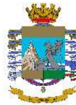
Guardia di Finanza

Comando Provinciale Carabinieri di Brescia