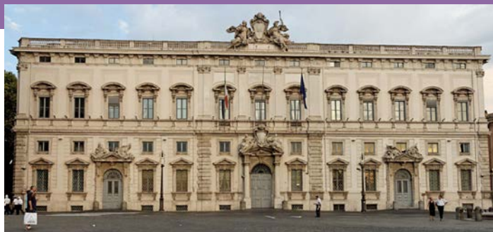
La sede della Corte Costituzionale.

pre consentita la riproduzione audiovisiva delle dichiarazioni della vittima, che deve essere ascoltata con l'ausilio dello psicologo/psichiatra, non deve avere contatti con l'indagato mentre viene sentita e non deve essere chiamata più volte a deporre, salva l'assoluta necessità (art. 351, co 1 ter cpp).