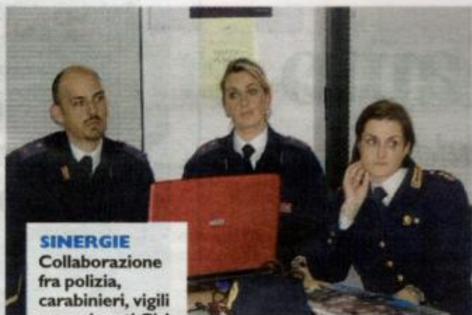
SINERGIE Collaborazione fra polizia, carabinieri, vigili e pensionati Cisl