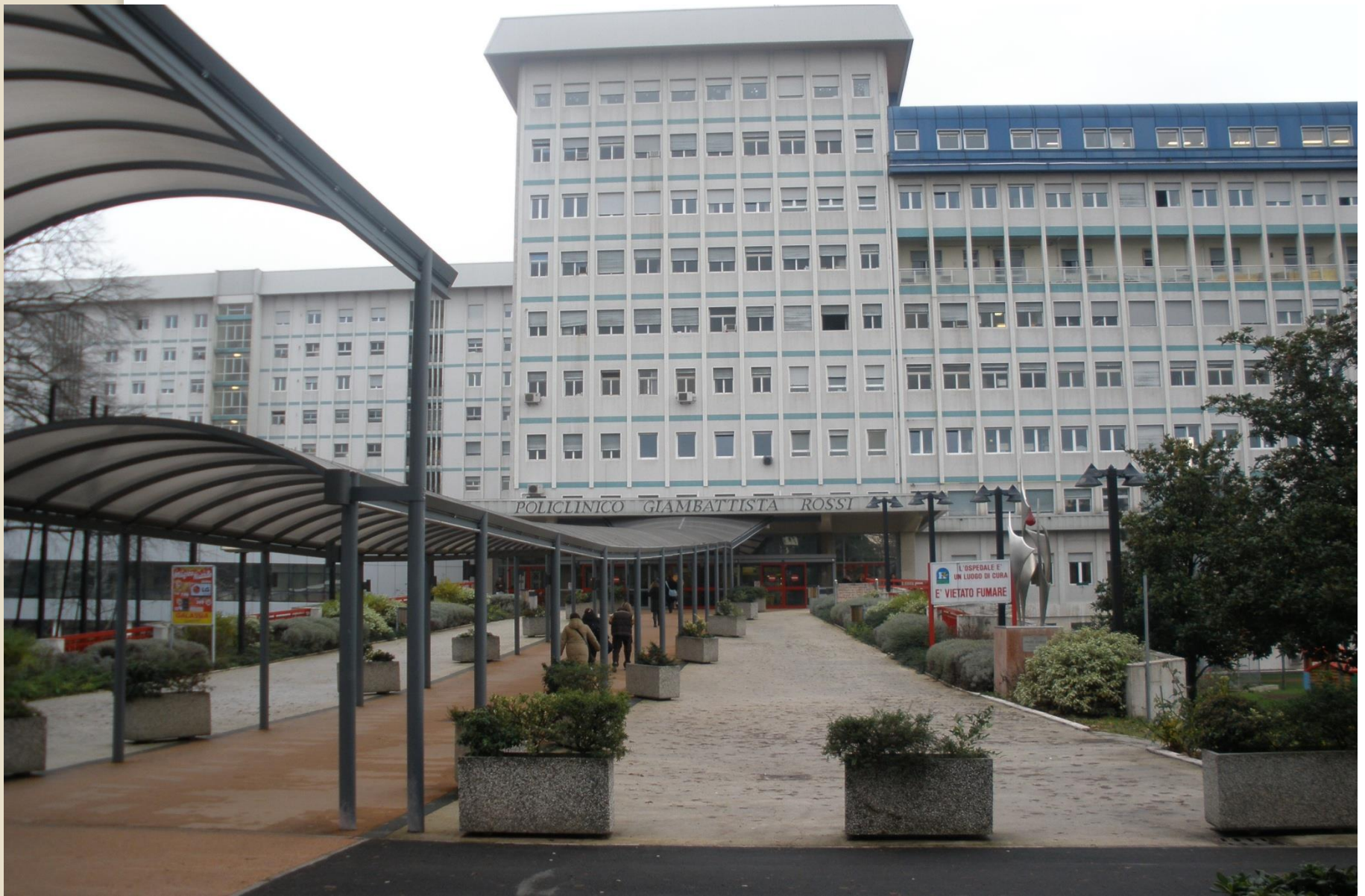
Policlinico di Borgo Roma - VERONA