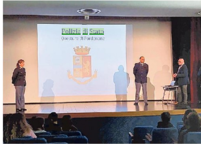
Il progetto della polizia di Stato a Zoppola