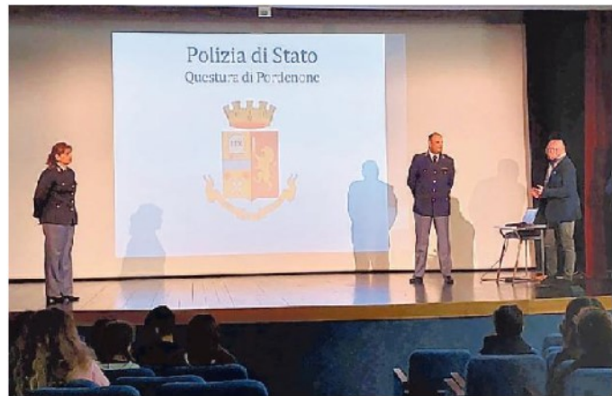
Un momento dell'incontro con gli studenti delle medie