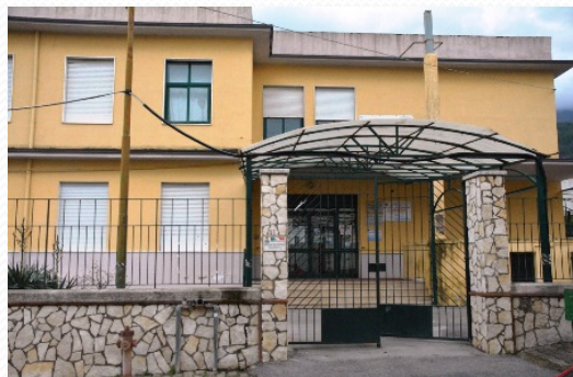
Classe 3 ^ sez. A - Plesso di Sirignano (Av) I.C. «A. Manzoni » di Mugnano del C. (Av)