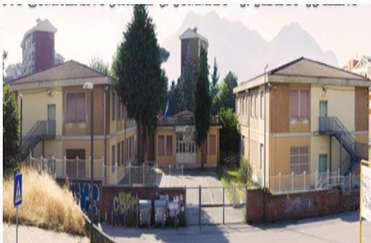
Classe 1 ^ sez. A , Plesso di San Tommaso I.C. «San Tommaso- F.Tedesco» di Avellino