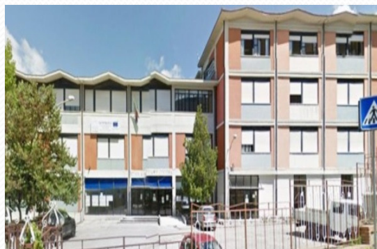
Classe 3 ^ Sez. D -Plesso di Avellino I.C. «Cocchia - Dalla Chiesa» Avellino