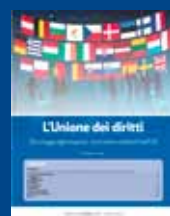
L'UNIONE DEI DIRITTI Aprile 2014