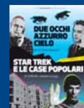
VINCITORI NARRATORI IN DIVISA Giugno 2014