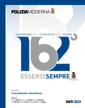
COMPENDIO DATI Maggio 2014