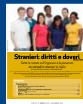
STRANIERI: DIRITTI E DOVERI Novembre 2013