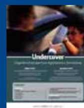
UNDERCOVER Marzo 2014