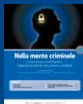
NELLA MENTE CRIMINALE Agosto/Sett. 2013