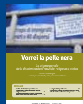
VORREI LA PELLE NERA Gennaio 2014