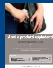
ARMI E PRODOTTI ESPLODENTI Luglio 2014