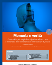
MEMORIA E VERITÀ Ottobre 2013