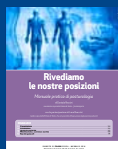
RIVEDIAMO LE NOSTRE POSIZIONI Gennaio 2014