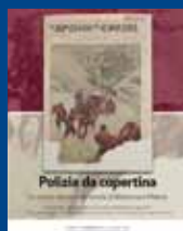
POLIZIA DA COPERTINA Luglio 2013