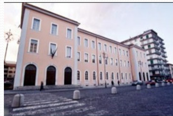
Classi 1 ^ Sez. C - 1 ^ sez. D, 1 ^ sez. E I.C. «Regina Margherita – L. Da Vinci» Avellino