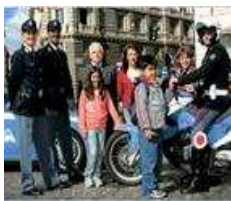
Vicini alla Gente

Vicini alla gente. Vicini ai bisogni sempre più diffusi di sicurezza che la società esprime a tutti i livelli, di fronte ai fenomeni di grande e minore criminalità.